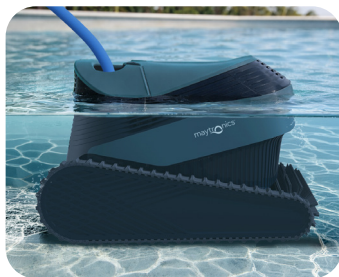
Nettoyage des plages immergées

Atteint les zones peu profondes et les plages immergées dès 30 cm.