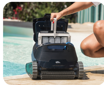
Système de filtration adaptable

Conçu pour offrir une couverture complète de la piscine, y compris les marches.